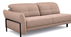
B300L (195 cm x 81/106 cm x 117 cm)