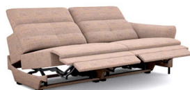
B3E2R (195 cm x 81/106 cm x 117 cm)