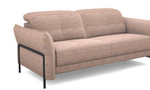
C200 (168 cm x 81/106 cm x 117 cm)