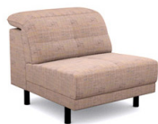
E150 (86 cm x 81/106 cm x 115 cm)

Modules disponibles (Available modules):