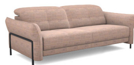
C300 (217 cm x 81/106 cm x 117 cm)