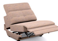
E150EL (86 cm x 81/106 cm x 115 cm)