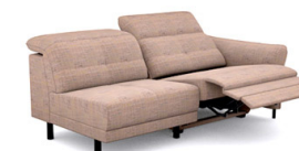
B3ER (195 cm x 81/106 cm x 117 cm)