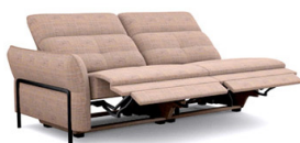
B3E2L (195 cm x 81/106 cm x 117 cm)