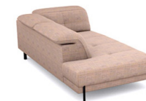
T02L (113 cm x 81/106 cm x 238 cm)