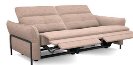
C3E2 (217 cm x 81/106 cm x 117 cm)