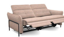
C2E2 (168 cm x 81/106 cm x 117 cm)