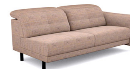
B300R (195 cm x 81/106 cm x 117 cm)