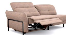
B3EL (195 cm x 81/106 cm x 117 cm)