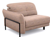
B150L (110 cm x 81/106 cm x 117 cm)